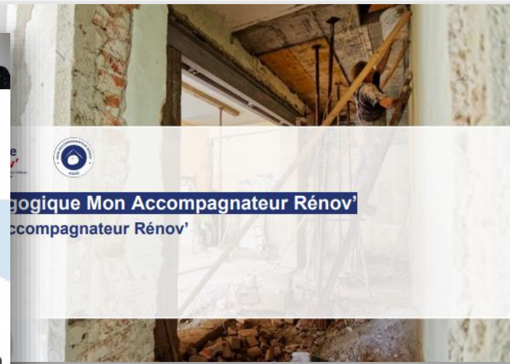
Webinaire et guide à destination des Accompagnateurs Rénov'