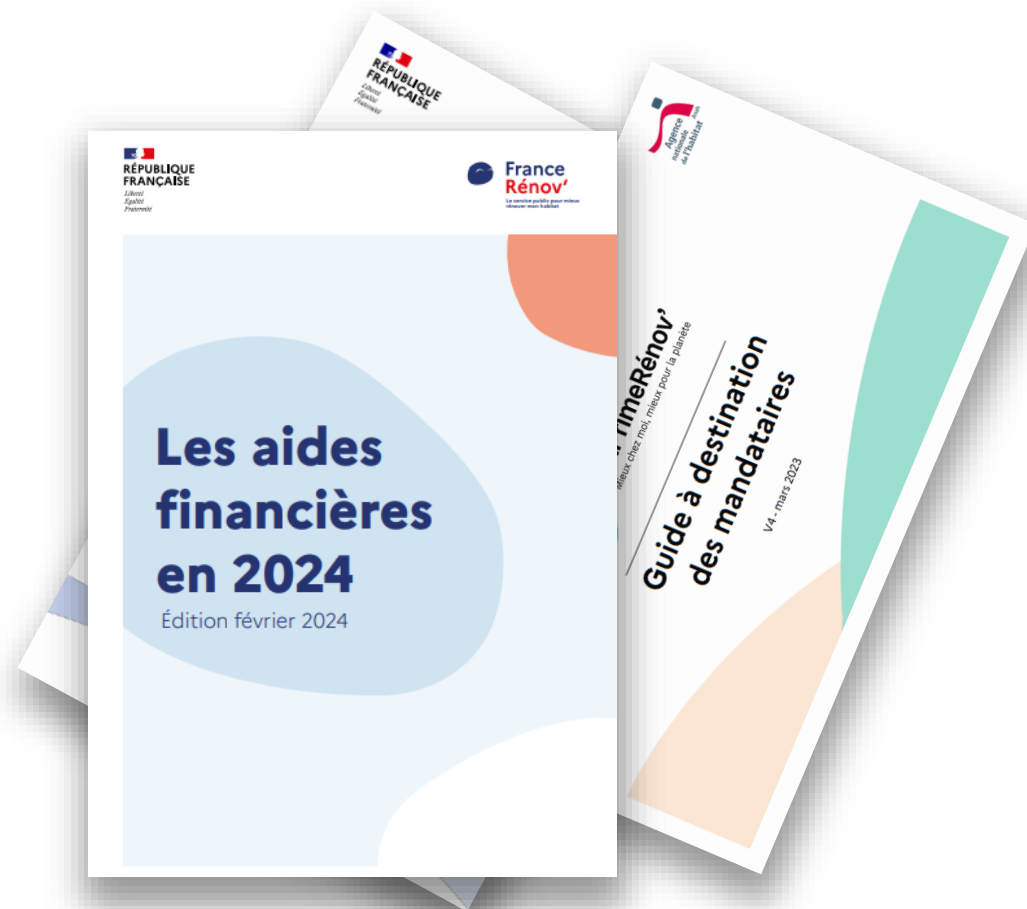
Accompagnement au financement des travaux