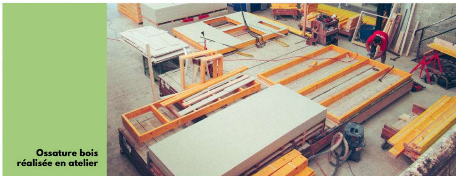
Ossature bois réalisée en atelier