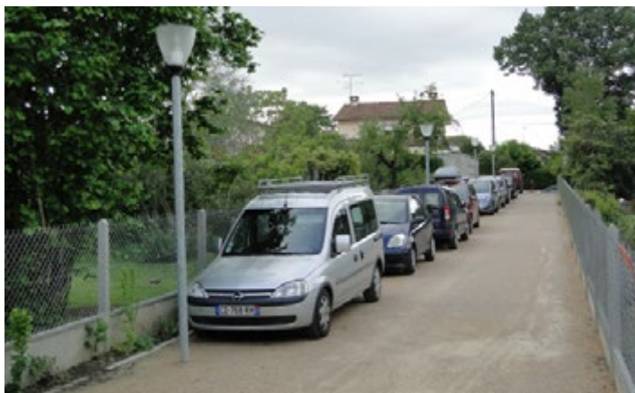
La zone de stationnement a été déportée pour limiter les interactions véhicules-piétons.