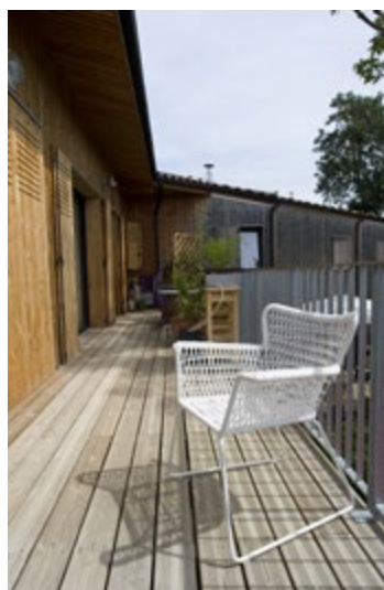
Le balcon d'un simplex côté sud.