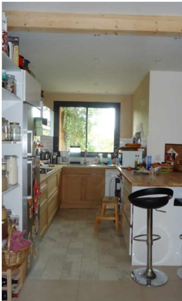
Un intérieur agréable grâce à une bonne luminosité naturelle.