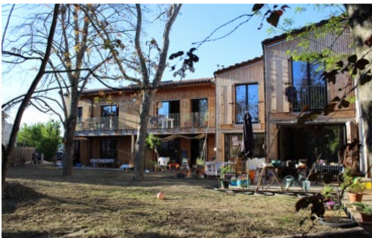
Façade sud.