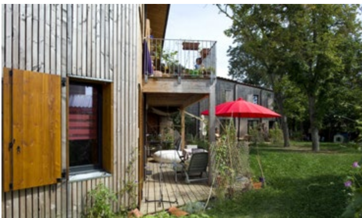
Façade sud-ouest.

L'article 47 de la loi ALUR du 24 mars 2014 définit un cadre législatif pour l'habitat participatif : « L'habitat participatif est une démarche citoyenne qui permet à des personnes physiques de s'associer, le cas échéant avec des personnes morales, afin de participer à la définition et à la conception de leurs logements et des espaces destinés à un usage commun, de construire ou d'acquérir un ou plusieurs immeubles destinés à leur habitation et, le cas échéant, d'assurer la gestion ultérieure des immeubles construits ou acquis. En partenariat avec les différents acteurs agissant en faveur de l'amélioration et de la réhabilitation du parc de logements existant public ou privé et dans le respect des politiques menées aux niveaux national et local, l'habitat participatif favorise la construction et la mise à disposition de logements, ainsi que la mise en valeur d'espaces collectifs dans une logique de partage et de solidarité entre habitants. »