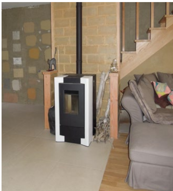
Des parois en terre crue ont été montées à proximité des poêles à bois pour une meilleure accumulation/restitution de la chaleur produite.