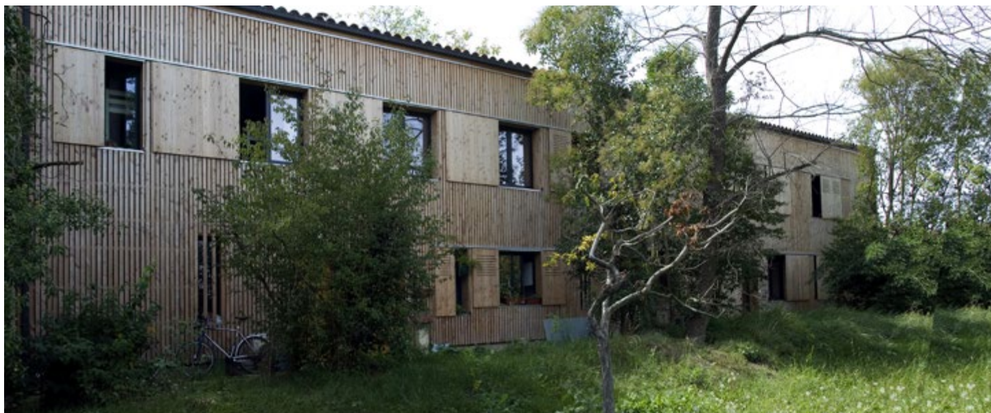
Côté nord-est : les arbres présents sur la parcelle ont pour la plupart été préservés.